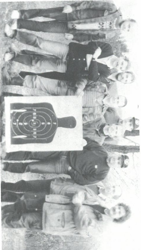
Članovi Kluba PPS Cluba Ljubljana na svojem prvom treningu

Na kraju da vas obavestimo, da bi se uskoro trebalo i kod nas održati prvo PPS takmičenje. Tačan datum još nije poznat, zbog raznih faktora, trenutno prisutnih u našem društvu, ali svakako ćemo vas blagovremeno obavestiti. Za sada vas samo možemo uputiti na adresu kluba PPS CLUB Ljubljana, Kersnikova 3. 61000 Ljubljana